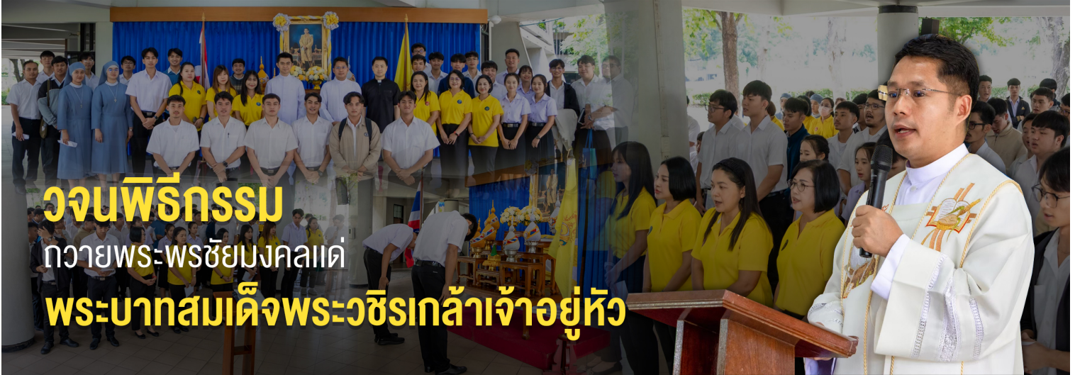
วจนพิธีกรรม ถวายพระพรชัยมงคลแด่ พระบาทสมเด็จพระวชิรเกล้าเจ้าอยู่หัว