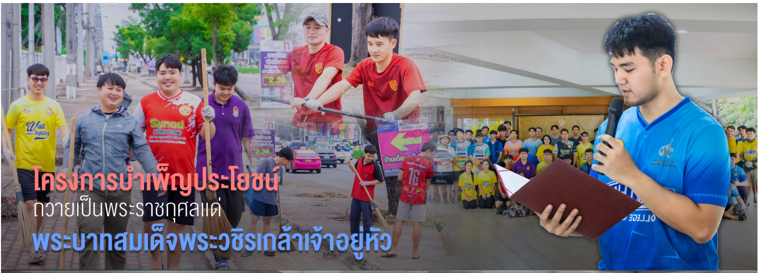
โครงการบำเพ็ญประโยชน์ ถวายเป็นพระราชกุศลแด่ พระบาทสมเด็จพระวชิรเกล้าเจ้าอยู่หัว