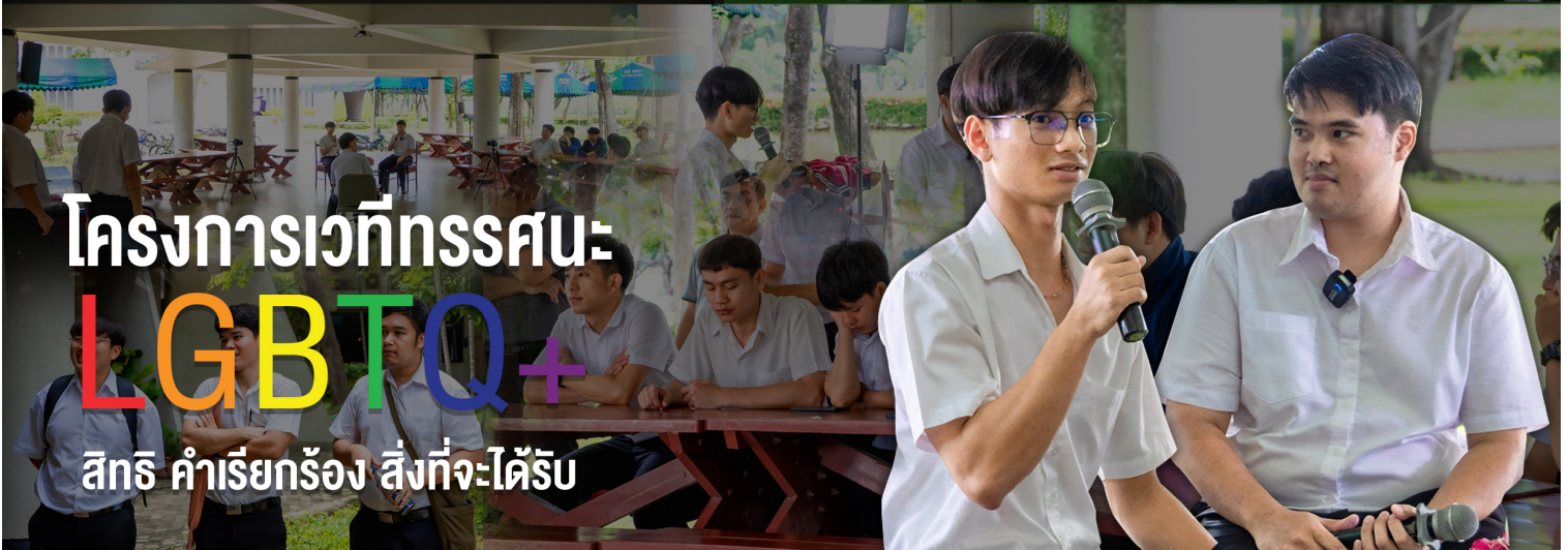
โครงการเวทีถรสนะ LGBTQ+ สิทธิ คำเรียกร้อง สิ่งที่จะได้รับ