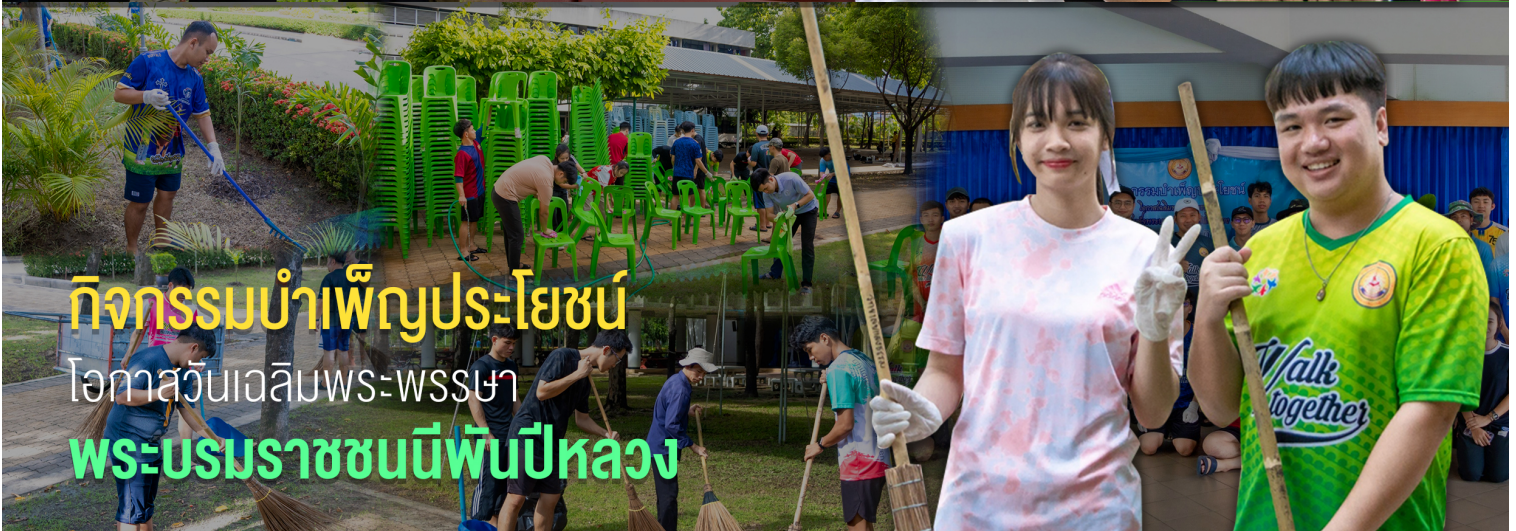
กิจกรรมบำเพ็ญประโยชน์ โอกาสวันเฉลิมพระพรรษา พระบรมราชชนนีพันปีหลวง